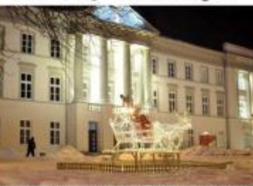
Przed radomskim magistratem gotowe są już świąteczne iluminacje. Czy mają szansę w konkursie „Świeć się” - załóż od internautów.