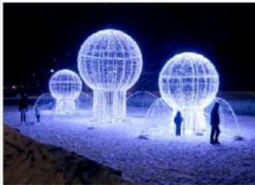
Iluminacja sferowa ul. Żelazny Szczeciński powitana Szczecinianami. Liczba głosów w konkursie.

GŁOSUJĄ NA SZCZECINIE I INNE MIASTA NASZEGO REGIONU W OGÓLNOPOLSKIM KONKURŚCIE NA NAJPIĘKNIEJSZĄ ILLUMINACJĘ ŚWIĄTECZNĄ. Oczywiście, jeśli uważacie, że światła w nich nie to załadunek.