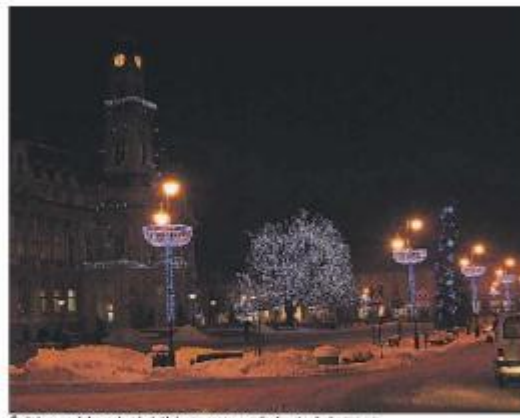
Świąteczne dekoracje oświetlają nocą nowoczesną starówkę