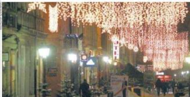
Najładziej w Bydgoszczy świąteczną iluminacją rozbiła w tym roku ul. Długa