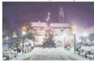
Oświetlenie Kluczborkiego rynku docenił Internauci.

KLUCZBORK. Wygraliśmy wojewódzki etap konkursu, teraz czas na zmagania krajowe.