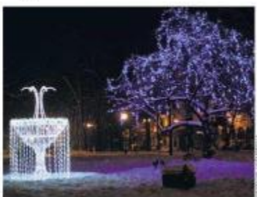
Tak świecą w święta i Nowy Rok nowosądeckie Plac

Na stronie internetowej www.swiecSie.pl można głosować na Nowy Sącz, rywalizujący w plebiscywie na najładniejszą iluminację świąteczną polskich miast. W wojewódzkim etapie konkursu stolica świąteczny polskoma nawiąże Kraków. Teraz reprezentuje Małopolskę w drugim etapie, walcząc o prymat z 15 innymi miastami i tym razem prymat w głosowaniu.