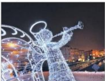
Świeczą antyki na ulicy Mostowej to prawdziwa atrakcja Bydgoszczy

Tymczasem internauci zwracają uwagę, że światło w mieście to nie tylko świeczka dekoracyjna. - Jest przecież pięknie oświetlona opera, której sceny widok jest prawdziwą wspaniałą Bydgoszcz. Widok wygląda jak katedra na placu Piastowskim i Bydgoska ścieżka. W oczy rzuca się ustronie oświetlenia dawnego technikum kolejowego, obecnie budynek UW - pisze jeden z internautów, który